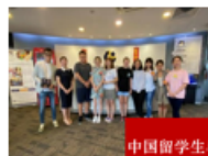
中国留学生与老师们合影